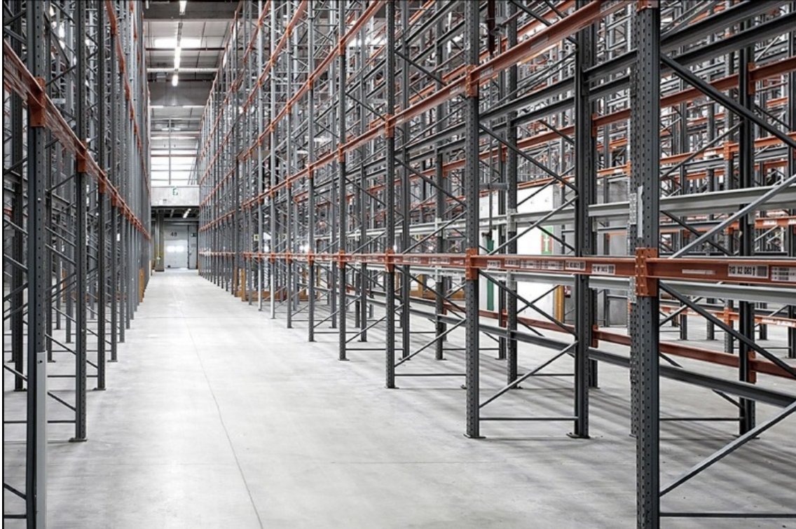
Innenansicht Halle 2