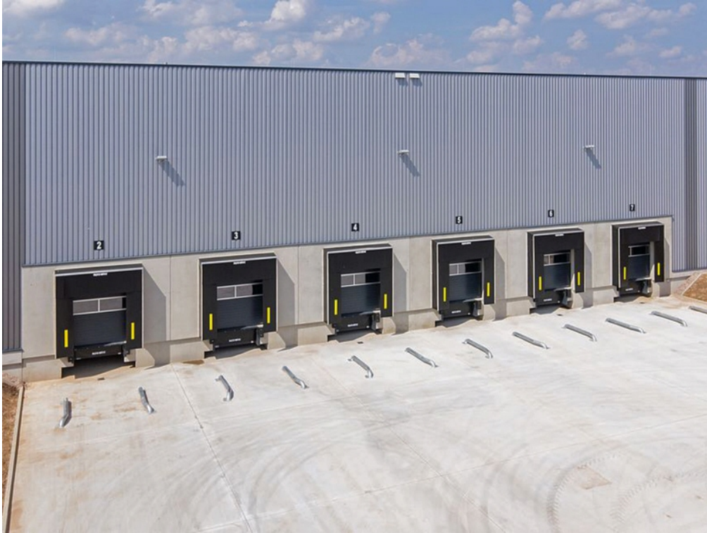
Beispiel Außenansicht Tore