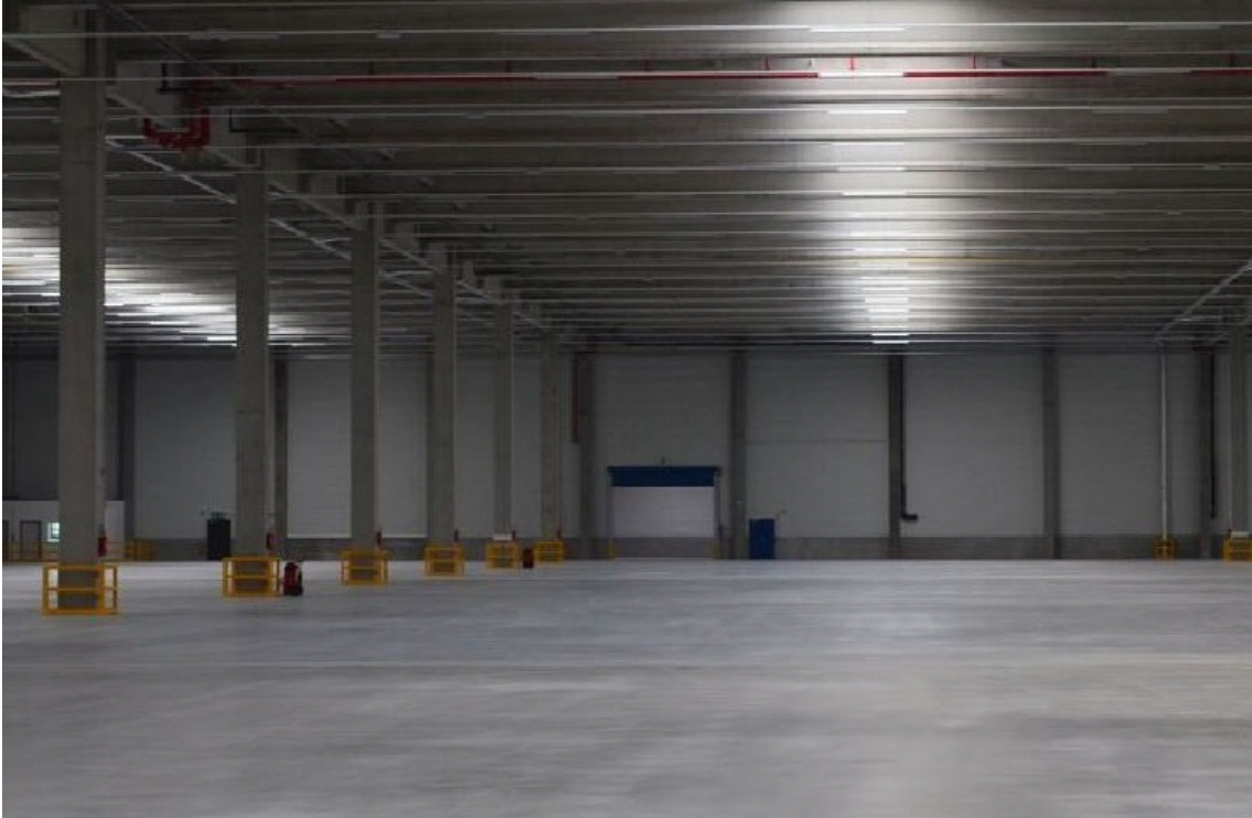
Innenansicht Halle - Beispiel