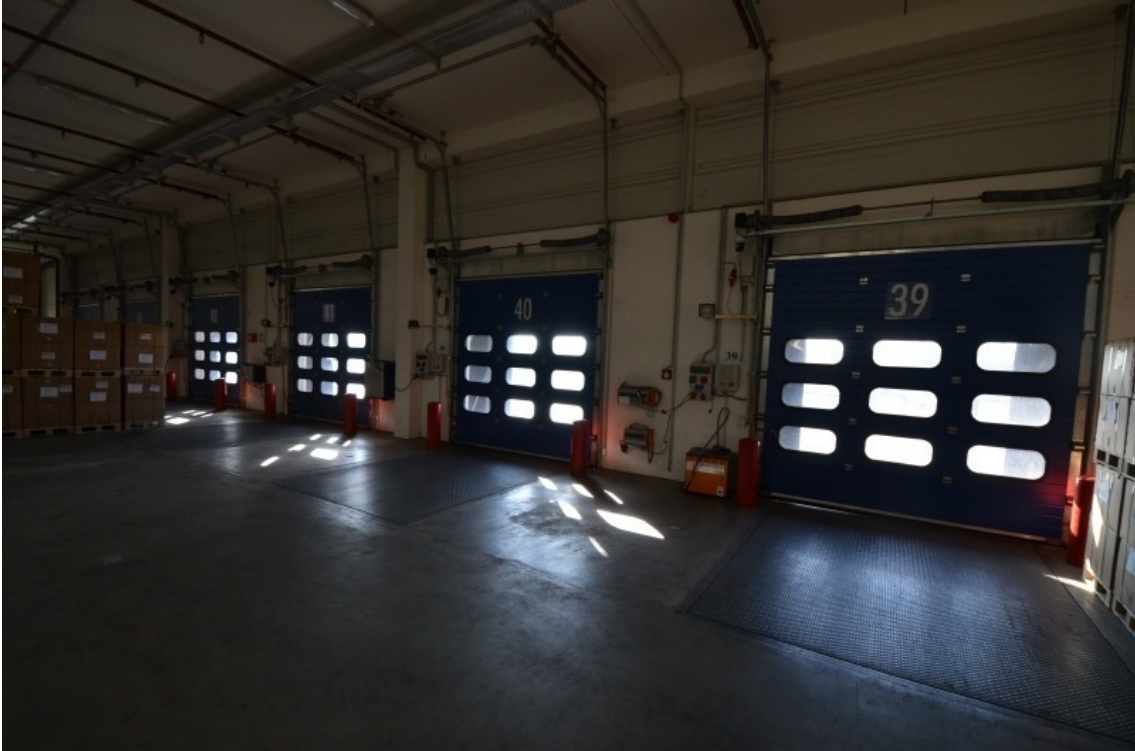
Rampentore mit Überladebrücken