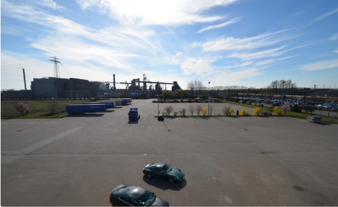
Freifläche - Stellplätze